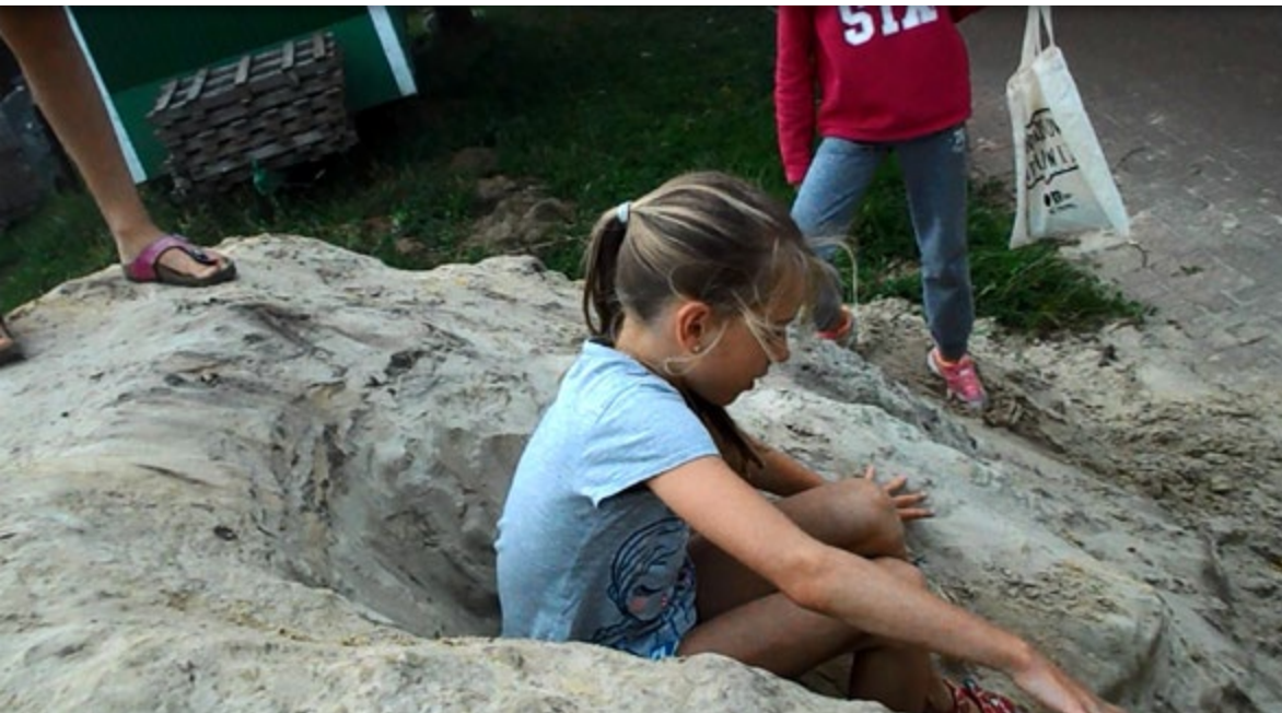
'Dit is de ingang naar de zetel. Hier kun je heel goed zitten. Dit is onze zandzetel. Die ligt heel erg goed. En nu gaan we naar de uitgang. De uitgang is een soort glijbaan die van zand is gemaakt. Nu gaan we nog even naar de slaapkamers. Dit zijn onze slaapkamers.'

Tot slot heeft elke buurt zijn eigen karakter. Ook kleine dingen, die er zomaar lijken te zijn, spelen daar hun rol in: een zandbergje, de boom waar je afspreekt, de kippen die de straat op lopen, het paard dat je mag aaien. Of de frituur en de broodjeszaak, voor wie in de binnenstad woont. En er zijn de verborgen plekjes, de struiken en bomen die, soms bijna onzichtbaar, plaats geven aan kampen. Als de gelegenheid er ook maar is, duiken kampen op in de directe woonomgeving van kinderen. Die bijna-geheime plekjes bevinden zich dan niet op het centrale pleintje, waar de sociale controle net te groot is, maar even verderop. De kippen, de zandberg, het struikgewas: het zijn de kleinoden van de buurt die niet speciaal zijn neergezet of ontworpen voor kinderen, maar die zij zich hebben toegeëigend.