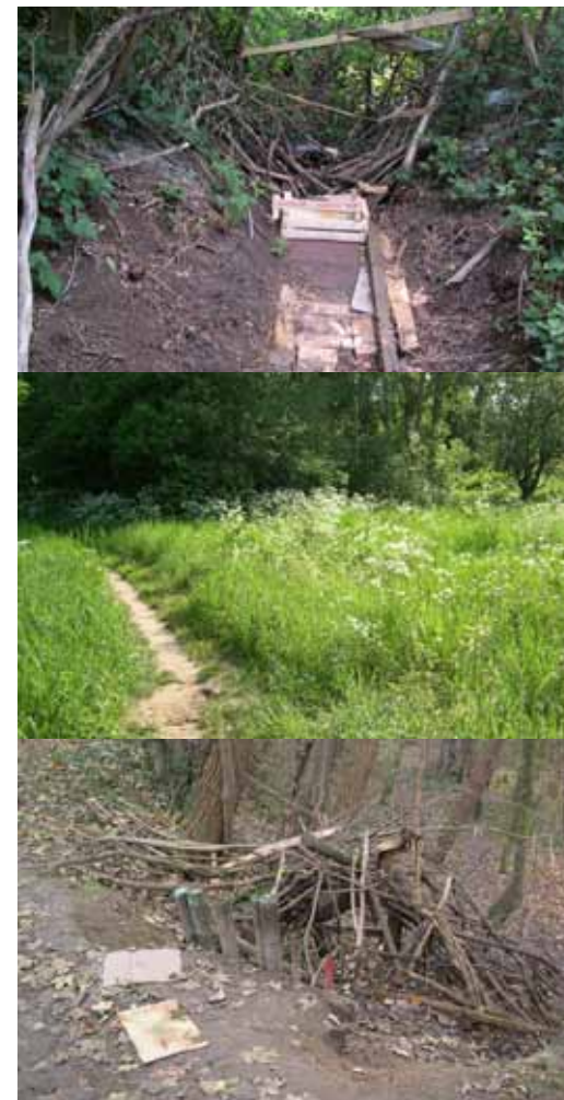
Sporen van informeel gebruik en spel: Resten van kampenbouw, indianenpaadjes, verfresten,...