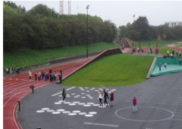
Vrij toegankelijk en speels vormgegeven sportcentrum in Odense (Denemarken). Kinderen worden op allerlei manieren uitgedaagd om speels te bewegen. Tegelijk blijft de uitoefening van de officiële atletiekdisciplines mogelijk.