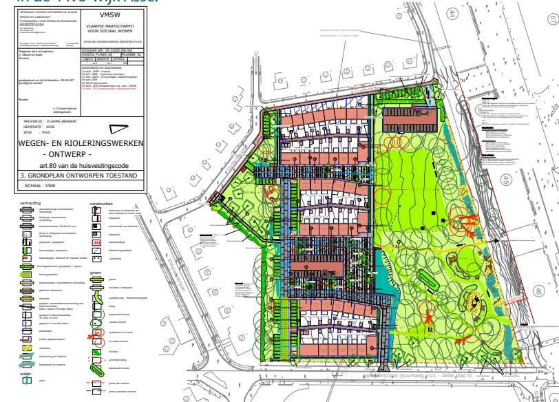
Ontwerplan Pivo-wijk Asse.