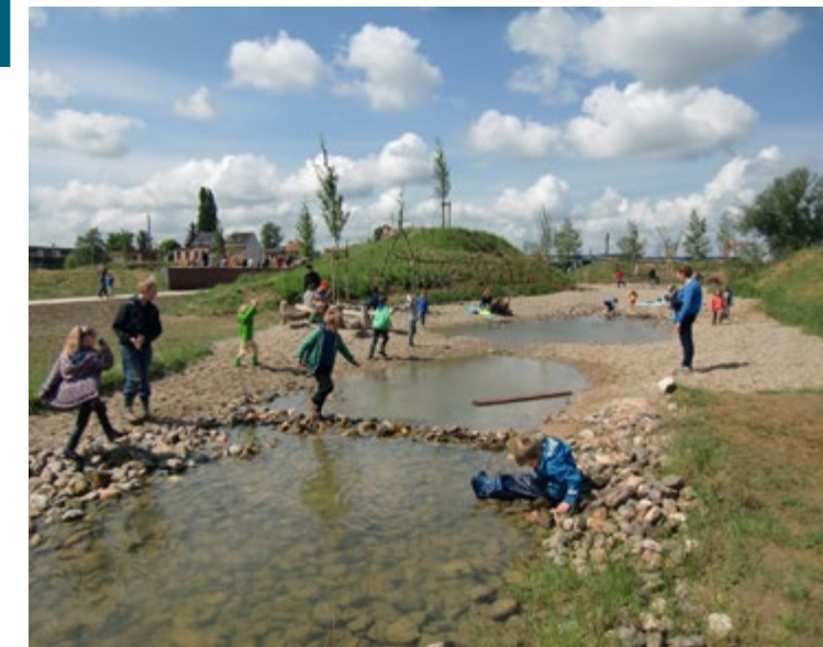
Wadi in Neerlandpark Antwerpen.

In Malpertuus in Gent is een wijkpleintje waaronder een groot waterservoir zit. Het hemelwater van de straten komt in de ondergrondse put, waarna het met een systeem van fotovoltaïsche cellen en een pompje in een mozaïekgoot wordt getrokken. Dat water loopt doorheen de hele wijk, tot in een wadi achteraan.