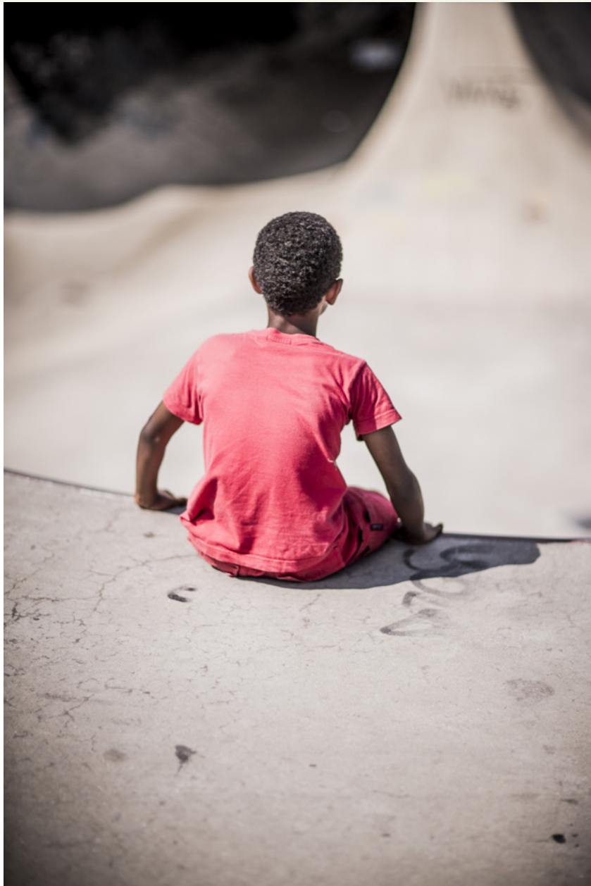
In het kader van het project spelen & ontmoeten